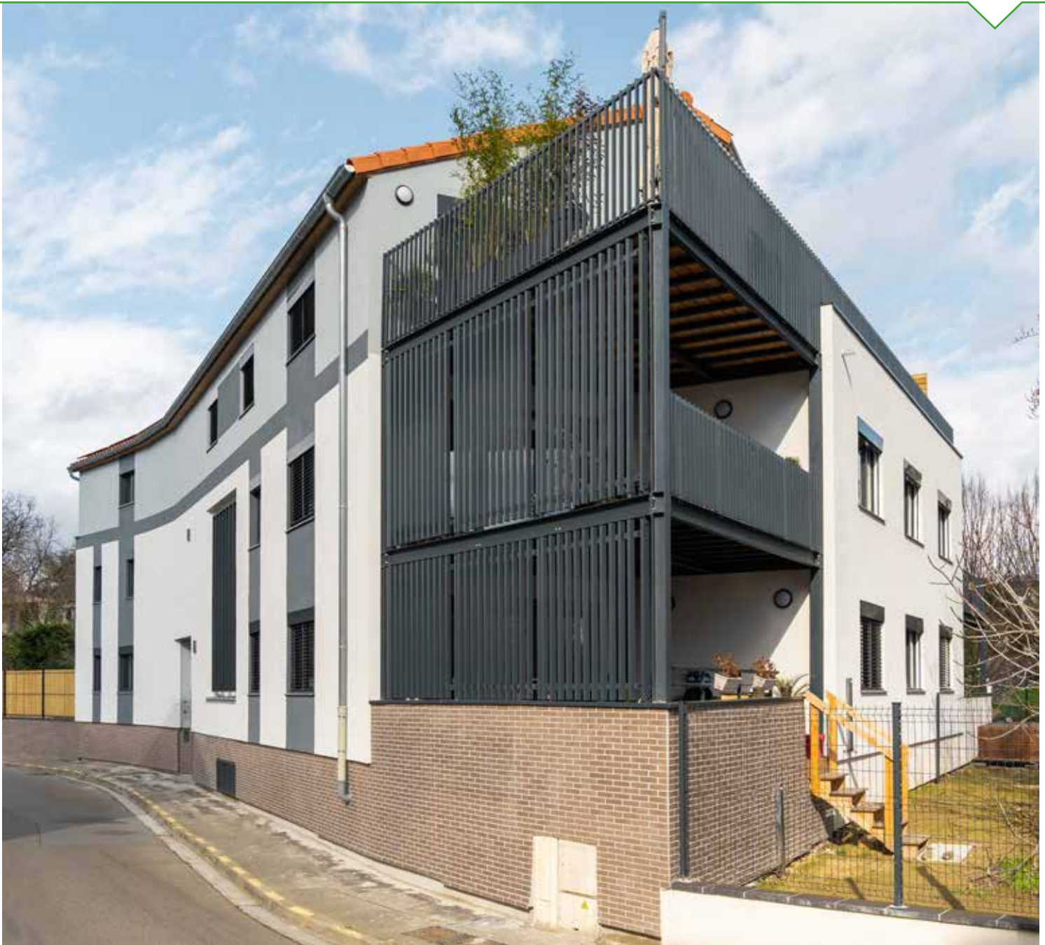
En pignon, les terrasses des logements 3, 5 et 7, protégées du soleil et des regards par un bardage métallique ajouré.

Les communs bénéficient de matériaux nobles et d'une belle luminosité naturelle.