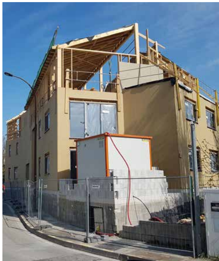
Une structure bois/béton avec des interfaces et des coupes complexes, parfaitement ajustées sur place par les charpentiers. L'ensemble est entièrement isolé par l'extérieur en fibre de bois.