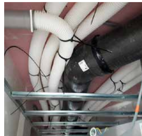
La VMC ComfoAir Q 350 de Zehnder et un détail des gaines en faux plafond.