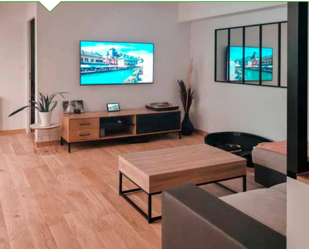
Des intérieurs conçus sur mesure répondant avec précision au cahier des charges des copropriétaires.